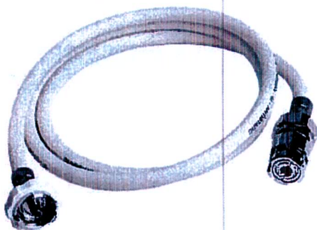
FLESSIBILE O 2 PREASSEMBLATO INNESTO AFNOR + PRESA AFNOR