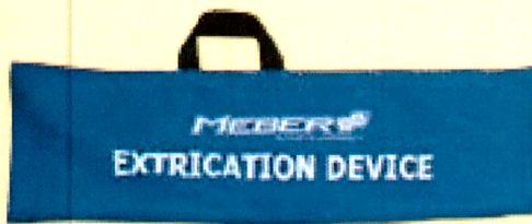
Art. 9124/B Immobilizzatore spinale standard colore blu

Presidio essenziale per immobilizzare ed estrarre un paziente in tutta sicurezza. È prodotto in nylon e vinile. Completo di cuscino imbottito, 2 cinturini e borsa da trasporto.