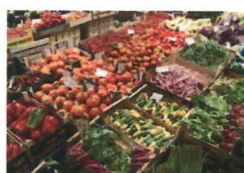
Magazzini conservazione frutta e verdura