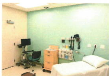
Ambulatori medici o dentistici