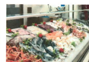
Magazzini conservazione pesce