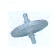
Cod. prodotto LRA202* Filtro antibatterico * La forma può cambiare a seconda della disponibilità