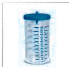
Cod. prodotto LRA310 Vaso completo da 1000cc autoclavabile