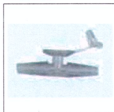
Cod. prodotto LRA100 Valvola di regolazione di sicurezza dell'aspirazione sterile Fingertrip