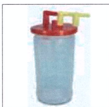
Cod. prodotto LRA315 Sacco monouso 1000cc da inserire nel vaso autoclavabile